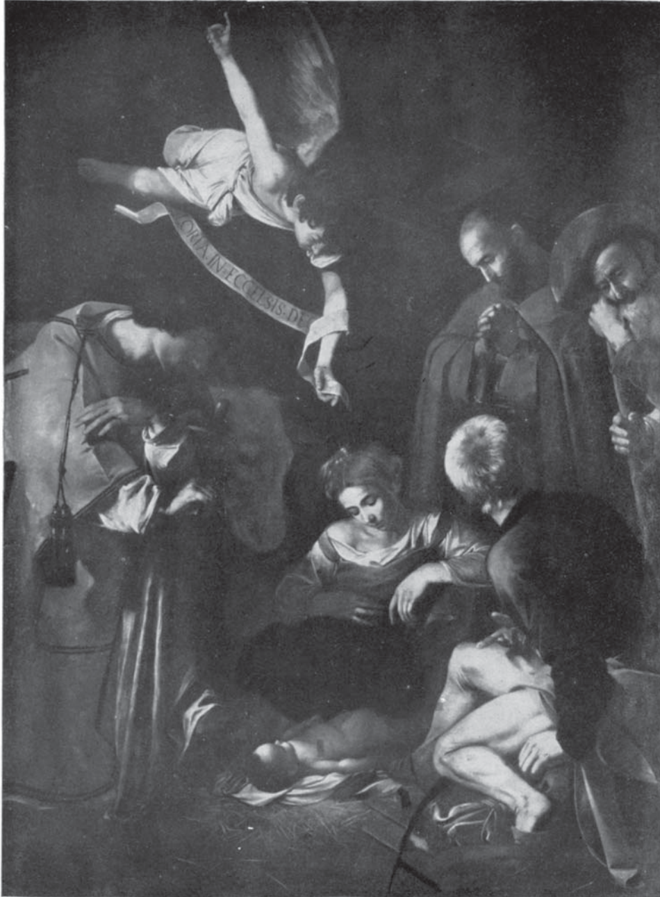
Fig. 4 – Caravaggio: Adorazione dei Pastori con i Santi Francesco e Lorenzo . Palermo, Oratorio di S. Lorenzo – Insieme del dipinto dopo il restauro