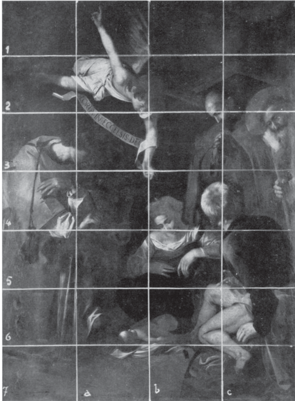
Fig. 1 – Caravaggio: Adorazione dei Pastori con i Santi Francesco e Lorenzo . Palermo, Oratorio di S. Lorenzo – Insieme del dipinto prima del restauro